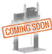
Materialversorgung dos prep

Achssystem inklusive Schutzzone für Bewegung des Dosierers in 3 Freiheitsgraden.