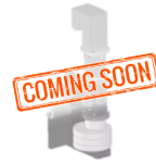
Zahnraddosierer dos gear

Materialverguss von 0,1 bis 43 ml für abrasive und nicht abrasive Materialien.