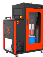
Materialversorgung dos feed H

Aufbereiten und Fördern von abrasiven und nicht abrasiven Materialien bis zu einer Viskosität von 70.000 mPa·s.