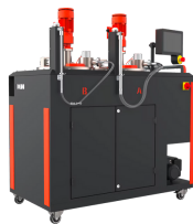
Materialversorgung dos prep

Maßgeblich für ein prozesssicheres Dosieren ist eine optimale Materialaufbereitung (z.B. Entgasen oder Temperieren) und der störungsfreie Transport des Materials zum Dosierer. dosmatix stellt hierfür das richtige Equipment bereit.